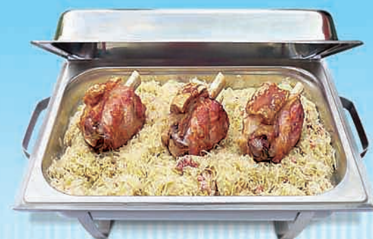
Grillhaxe ohne Schwarte