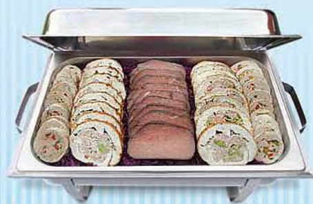
Gefülltes Schweinefilet, Rinderschmorbraten und Schweinerollbraten