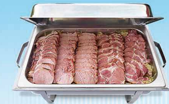
Kasslervariation in Scheiben

Wählen, schmecken und genießen Sie unsere leckeren warmen Speisen.