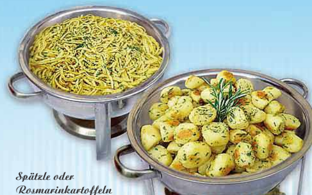
Spätzle oder Rosmarinkartoffeln

Die perfekte Ergänzung zu den warmen Speisen finden Sie hier in unserem leckeren Sortiment an deftigen Beilagen.