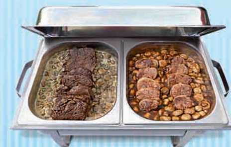
Filetpfanne vom Rind und Schwein