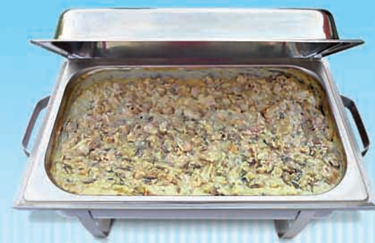
Schlemmerpfanne Jäger-Art mit Geflügel