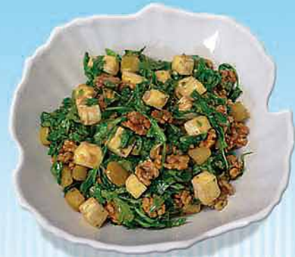
Birnen-Nuss-Salat mit Camembert

Gönnen Sie sich vor dem eigentlichen Hauptgericht eine leckere Vorspeise oder Suppe aus unserem Hause.